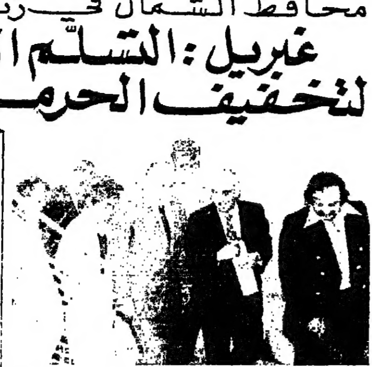
المحافظ صاعدا الى السراي مع مسؤول لجنة الترميم ومراسل الانوار في طرابلس

وقال قائد الدفاع ان زيارته لطرابلس ليست الاولى، بل هي الرابعة، حيث استعرضت اوضاع الابن فيها في اوضاعها الشمالية، وتكاتف على احتياجات رجال الدفاع من البنية التحتية، كما استعرضت اوضاع المدارس فيها من اجل طمأنة اولادها التحصيل العلمي في السنوات المقبلة.